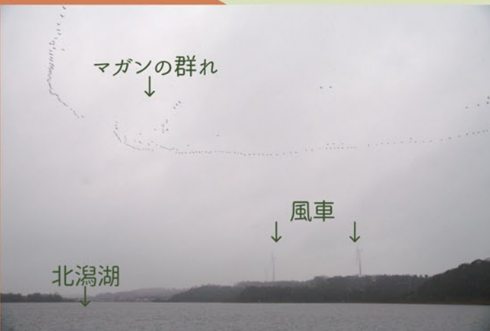
↑北潟湖上空を通過するマガン。天候や風向きによってはより風車に近いところを通ることもあります。風車は現在稼働を停止していますが、衝突の危険がなくなったわけではありません。

鴨池に毎年飛来する天然記念物のマガン。朝早くに鴨池を飛び立ち、福井県の坂井平野のたんぼへ餌を食べに行き、夕方また鴨池に帰ってきて夜休む...という日々を過ごします。坂井平野を行き来する途中、北潟湖の上を通過します。この湖のそばに6年前、10基の風車が建てられました。世界中で風車を利用した風力発電が行なわれていますが、野鳥の生息域と重なる場所では、風車に衝突したり風車そのものを嫌がって生息地を変えてしまったりといった問題が起きているところも少なくありません。鴨池に飛来するマガンたちにも同じ危険が起これないか、建設される前から(公財)日本野鳥の会、日本野鳥の会福井県、鴨池観察館友の会、観察館レンジャーが協力して調査を続けてきました。