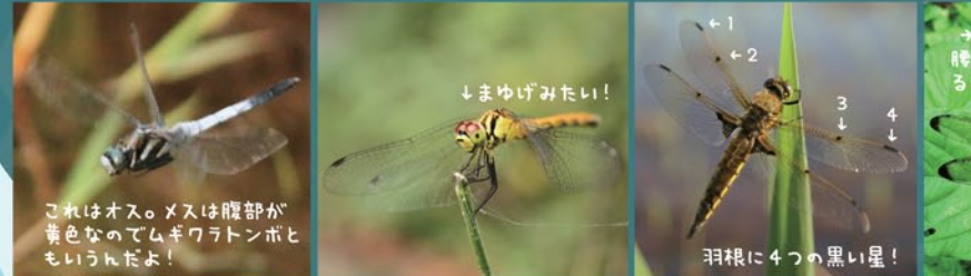
シオカラトンボ マユタテアカネ ヨツボシトンボ

トンボ科ってグループに入ってるトンボや。大きさもそれぞれやけど、体長4cm~5cmくらいのもんが多いんね。右上のかもいけ歳時記に出てくる千ヨウトンボもここに入るんや。たんぼみち歩いてるとシオカラトンボがすぐ飛んでくるぞ。よお似たコフキトンボもあるし見分けてみんね?真っ赤つかのショウジョウトンボはこれからよお出てくるんわ。