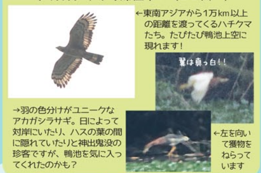
←東南アジアから1万km以上の距離を渡ってくるハチクマたち。たびたび鴨池上空に現れます!

*6月の鴨池に来た鳥・いた鳥・事件などなどハイライトをご紹介します! ・ハチクマ4羽鴨池上空通過(21日) ・アカガシラサギ滞在中!(23日~)