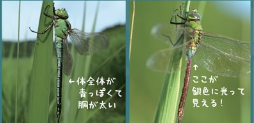
アオヤンマ ギンヤンマ ヤブヤンマ

この3種はイトトンボのなかまや。体長は3cm~5cmくらいで、ほぞ~し体しとる。鴨池たんぼの稲の間とか、畦の草むらあたりのぞいてみるとよく見つかるわ。ほかにもアジアイトトンボとかモートンイトトンボっていうのもあるぞ。