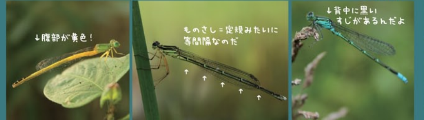
キイトンボ モノサシトンボ セスジイトンボ

この3種はイトトンボのなかまや。体長は3cm~5cmくらいで、ほぞ~し体しとる。鴨池たんぼの稲の間とか、畦の草むらあたりのぞいてみるとよく見つかるわ。ほかにもアジアイトトンボとかモートンイトトンボっていうのもあるぞ。