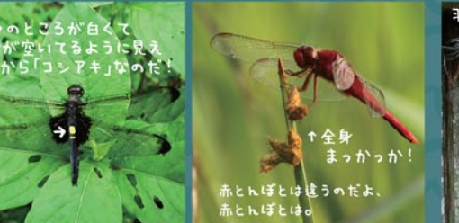
コシアクトンボ ショウジョウトンボ

トンボ科ってグループに入ってるトンボや。大きさもそれぞれやけど、体長4cm~5cmくらいのもんが多いんね。右上のかもいけ歳時記に出てくる千ヨウトンボもここに入るんや。たんぼみち歩いてるとシオカラトンボがすぐ飛んでくるぞ。よお似たコフキトンボもあるし見分けてみんね?真っ赤つかのショウジョウトンボはこれからよお出てくるんわ。