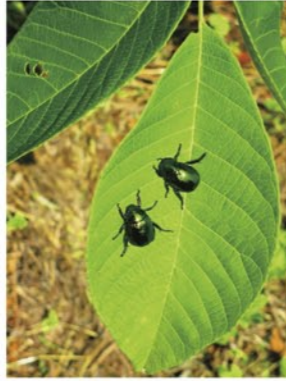
6月 コガネムシ