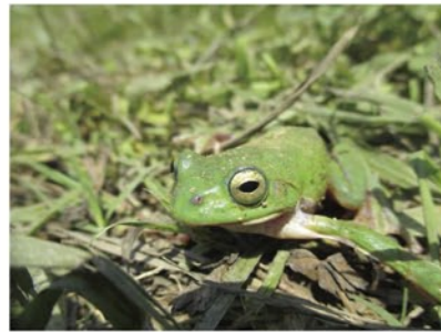
5月 シュレーゲルアオガエル

5月3日から8月31日まで行われた「カメラで虫撮り」。 期間中は雨の日も多かったのですが、期間中88名の方に虫撮りを楽しんでいただきました。今年から始まった月間レンジャー賞と2014総合グランプリ作品をご紹介します！