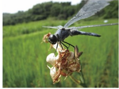
7月 コフキトンボ